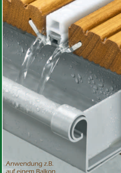
Anwendung z.B. auf einem Balkon